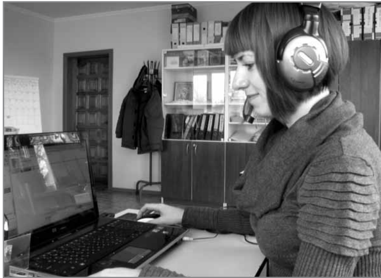
Спілкування по Skype технікою.

Досліджуючи це питання ми наштовхнулися на досвід бібліотек Рівненської області, де завдяки Скайп-зв'язку люди змогли знайти та поспілкуватися зі своїми родичами та друзями, яких не бачили десятки років. Доречі, саме у Рівненській області проходив експеримент, який передбачав оснащення саме шкільних бібліотек комп'ютерною