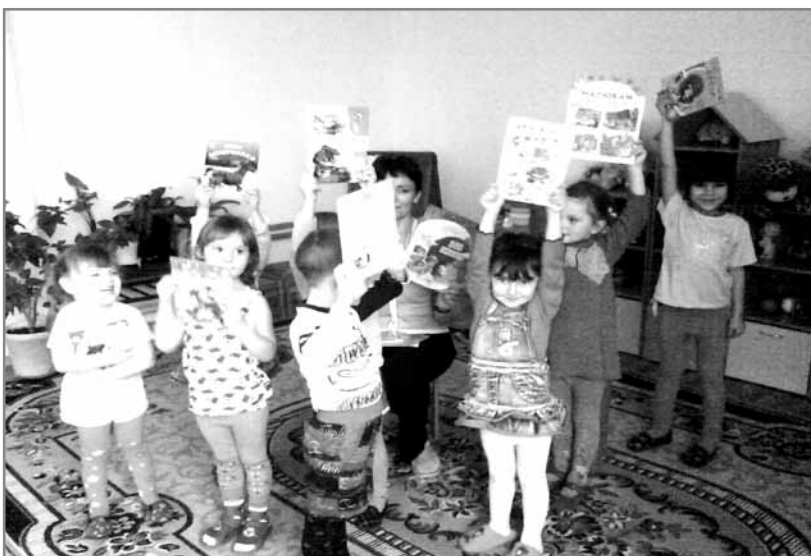
Завдяки активності громади ці діти можуть відвідувати дитячий садок, с. Новобогданівка, Миколаївська область