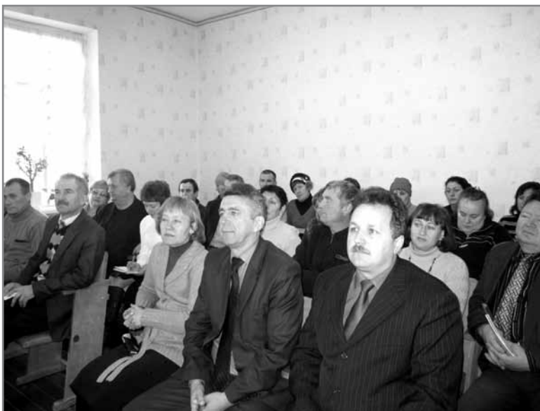
Семінар у с. Дворічна, Харківська область

24 листопада 2011 року у с. Дворічна Фондом був проведений семінар «Сільські клуби