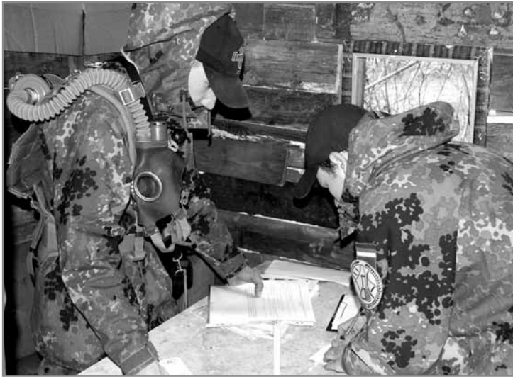
Квест «Сталкер» до дня трагедії на ЧАЕС

використанням альпіністського спорядження.