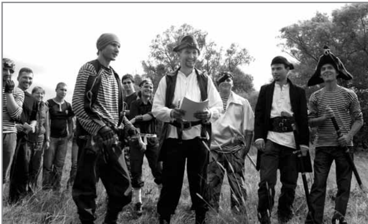
Квест «Пірати Десни»

Наш клуб дбає не тільки про розвиток спорту, а й бере активну участь у міських тренінгах, дбає про розвиток партнерства з молодіжними організаціями. Члени клубу отримали практичні навички по таких програмах як «Молодіжне лідерство», «Створення ініціативних груп та молодіжних громадських організацій», «Організація змістовного дозвілля молоді» і т. д. Організатором семінарів була МГО ЦПМ «Апельсин». Так почалася плідна співпраця двох організацій. На базі клубу «Альтернативний 38-й», який утримує «Апельсин» проводяться збори та тренування клубу «Семаргл», готуємо походи (піші, велосипедні, водні), турніри з пейнтболу, страйкболу, екстремальні розваги з