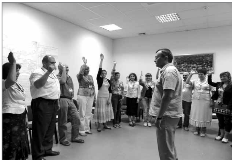
Підготовка “громадських аніматорів”, тренінг “Анімація громадської діяльності”, м. Ірпінь

- Оскільки дане питання є дуже спірним і прогнози можуть бути різними і в багатьох випадках дуже протилежними однозначної відповіді дати не можливо. Майбутнє закладів культури залежить від держави і самої місцевої громади. Такі заклади як клуби і бібліотеки переважно розташовані у сільській місцевості та районних центрах і утримуються за рахунок місцевих бюджетів. Враховуючи існуючу тенденцію зменшення видатків на культуру у місцевих бюджетах