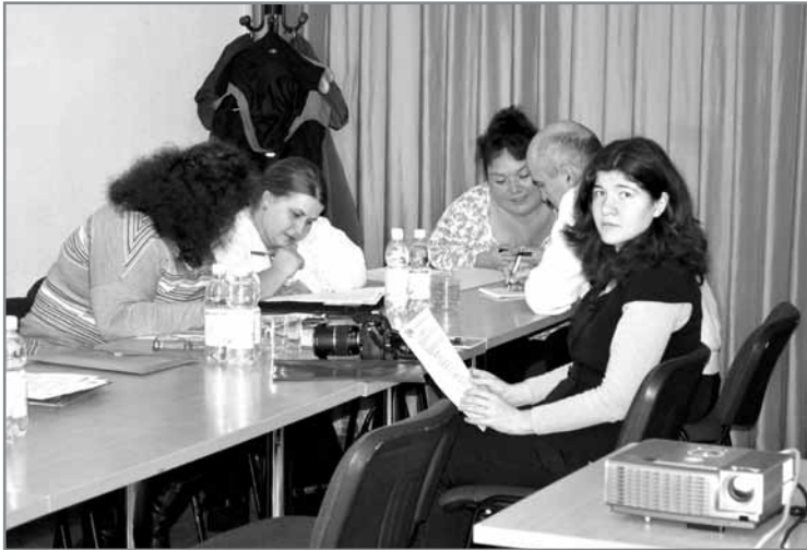
Учасники тренінгу «Кампанія адвокати: план дій»,