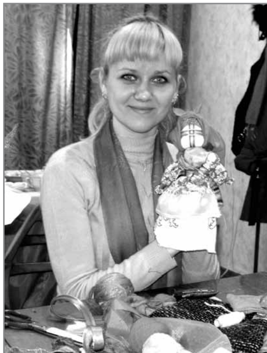
Майстер-клас із виготовлення ляльки-мотанки