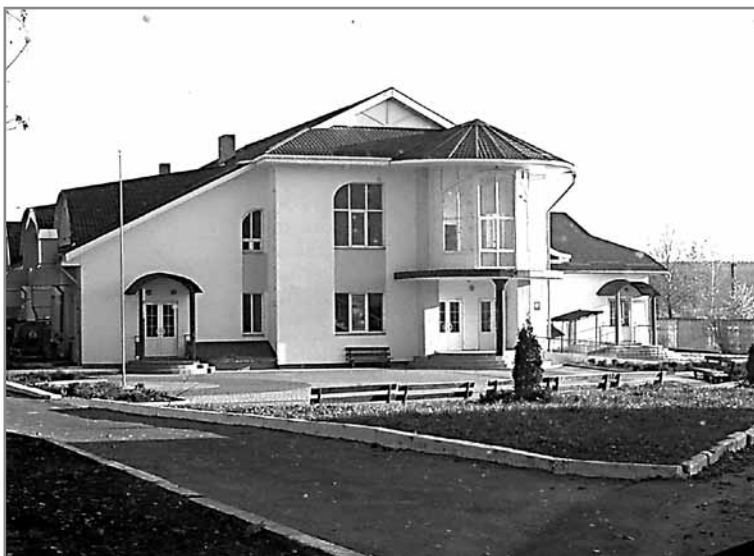
Новий (не опалюваний) Будинок культури в с.Забір'є, Київська область