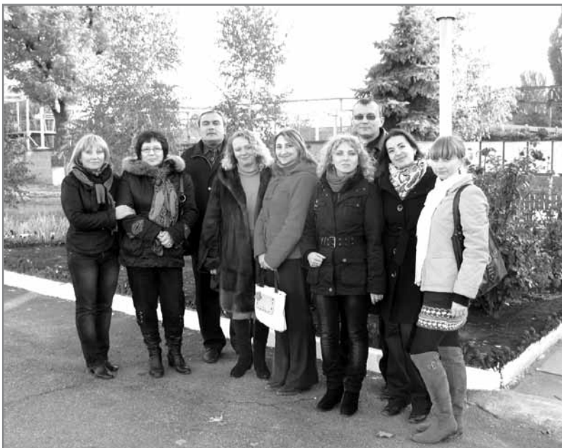
Колектив ІСКМ разом із партнерами

- Якщо переробити питання на таке, що стосується ролі ІСКМ, то відповідь має відобразитись у завданнях, які ставить собі ІСКМ.