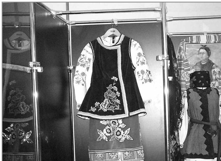
Експонати музею у селі Забір'є, Київська область

колеритний побут простих селян надихали художника М. Пимоненка, (видатний український жанровий живописець, академік Імператорської Академії мистецтв, член Товариства пересувних художніх виставок - ред.), який жив у сусідній Малютенці, на написання своїх полотен.