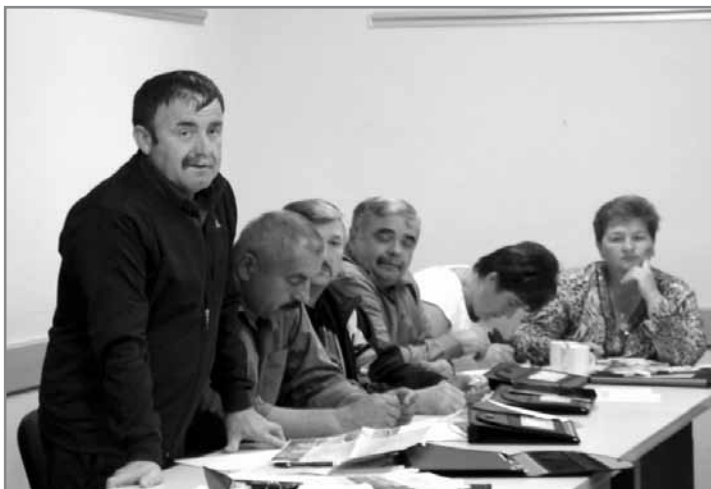
Сільський голова розповідає про пріоритети розвитку мікрорегіону

Однією з найголовніших умов успішної співпраці Західноукраїнського ресурсного центру з громадами є наявність міцних за мотивованих місцевих ініціативних груп мешканців, які хочуть працювати для розвитку своїх громад. Саме наявності міцної ініціативної групи ЗУРЦ приділяє першочергову увагу перед тим, як починати співпрацювати з громадою.