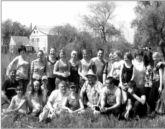
Ось як виглядає згуртована громада

Найважче завжди робити перші кроки, але коли вони зроблені – це вже як сніжний ком.