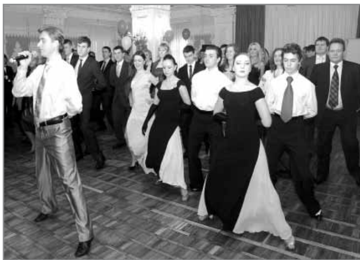
Хореографічний ансамбль «Сузір'я», м.Ірпін

Передусім на базі Центрального будинку культури виникли нові клуби, серед яких: Клуб цікавих зустрічей «Діалоги з майстрами», Філософський клуб «Еліта народу», Клуб «Шедеври світового кіномистецтва», Жіночий клуб «Лада», Туристичний клуб, Клуб знавців англійської мови «English Club», Клуб спонтанної творчості, Клуб авторської пісні, Шахово-шашковий клуб для дітей і юнацтва, Клуб «Здоров'я». Ранкова зарядка