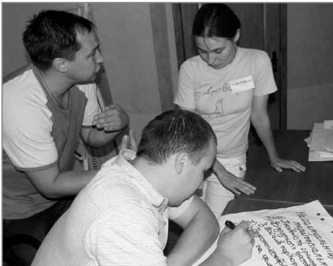
Визначення найактуальніших проблем громади

Всі учасники перед початком Школи поділилися своїми очікуваннями про те, що в них є бажання отримати нові знання або удосконалити старі, набути досвіду по розвитку громад, зав'язати нові знайомства. Дехто відмітив, що навчання спонукає до досконалості або правильності обраної мети, тому постійно набувати нових знань дуже важливо. Учасники також намагалися