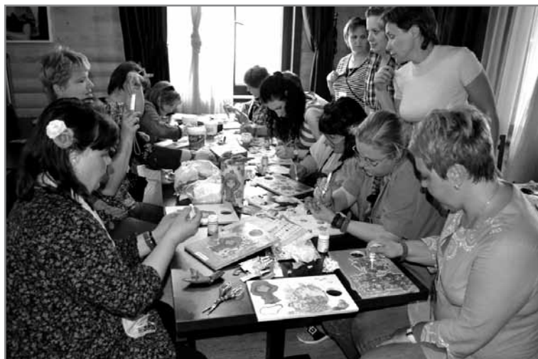
Майстер-клас із декупажу

Мета форуму – на початку оголошувалася як створення загальноросійської, а зрештою міжнародної спільноти експертів в сфері активізації громадян (соціальних аніматорів), консолідації і професіоналізації лідерів місцевих громад. Форум соціальних аніматорів – це самоорганізований майданчик експертів в сфері громадської (неполітичної) активізації громадян, в тому числі – активізації по місцю проживання.