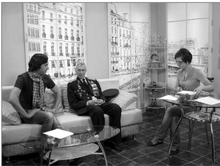
У студії ветеран ВВВ в рамках проекту до 9 травня