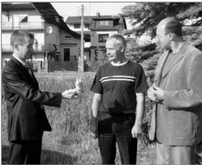
Під час передачі досвіду з розвитку самоврядування у колі активістів місцевих громад

Інші форми нашої роботи в цьому напрямку включають навчання та