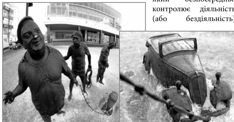
Фотоконкурс «Місто на виріст»

проблему буде вирішено. І ця схема працює на всій території Росії. Адже головне не просто скажитися, а скажитися у той орган,