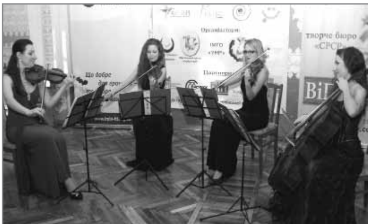
Жіночий струнний ансамбль «Міра», м.Київ