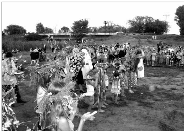
Святкували усі від мала до велика

Саме тому ми і розпочали роботу в цих напрямках. Так, протягом місяця ми організували свято Івана Купала, провели зібрання щодо розвитку баскетболу та