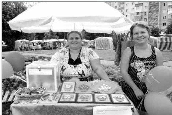
Гурткові роботи на ярмарку

Фонд громади Приірпіння, цього року створив перший іменний фонд. ІМЕННИЙ ФОНД ДМИТРА ВОЙЦЕХА – програма Фонду громади Приірпіння, що здійснюється