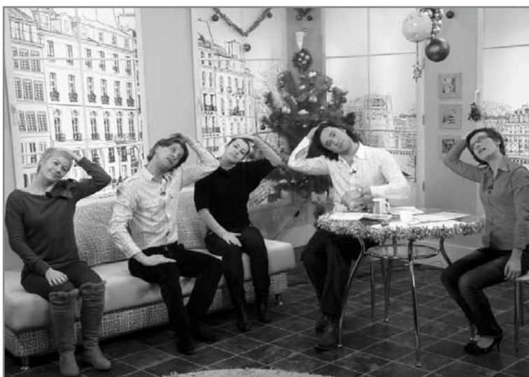
Разом з ведучими рубрики «Ранковий драйв»