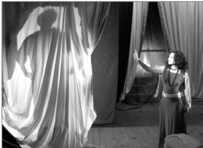
Музично-драматичний театр «Карнавал», В.Андрейцова.

Однак разом із цим гостро постали потреби в оновленні матеріально-технічної