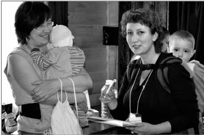
Для соціального аніматора немає обмежень у віці!

На форумі було представлено велику кількість інструментарію, який стане у нагоді соціальним аніматорам в повсякденній роботі.