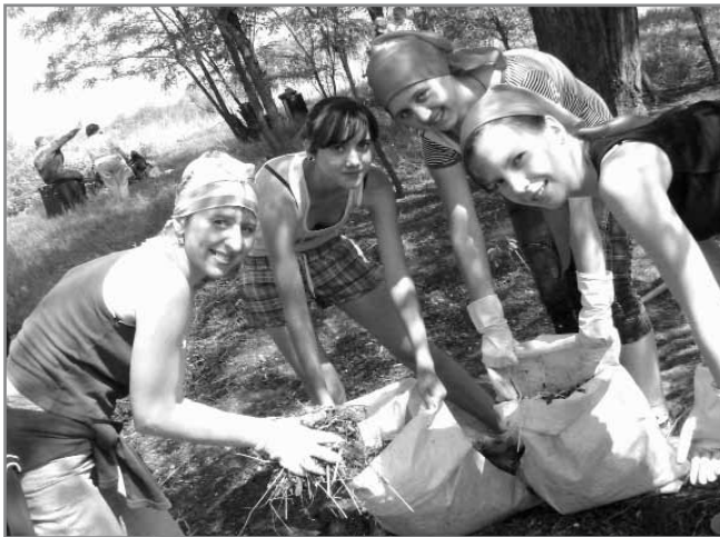
Разом і прибирати легше! провели тиждень «Чиста громада».