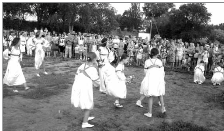
Святкування Івана Купала

А яке ж свято без народного гурту «Криниця». І лилися пісні над річкою Кільчень, і лунав сміх, і виконували завзяті танці навколо марени.