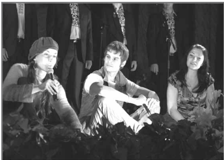
Музично-драматичний театр "Карнавал", м. Ірпінь

буклети, продумували святкову програму до найменших дрібниць... Уся ця робота ще більше згуртувала людей і почала заряджати ентузіазмом інших: кожен прагнув допомогти в міру своїх сил і можливостей. Адже майже усе, що відбувається у Центральному будинку культури – діє на громадських засадах, має некомерційний характер, а ситуація із фінансуванням закладу така ж сама, як і в усіх інших містах України. Бракує часом найважливіших речей (як не дивно, у Будинку культури немає жодного робочого комп'ютера!). То ж відроджувати осередки культури доводиться самій громаді. Що і почало відбуватися в Ірпені.