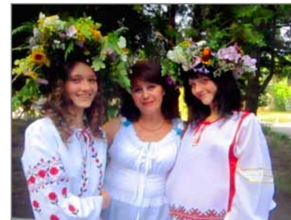
Свято «Івана Купала»

Восени цього року театр, що діє при Олександрівському Будинку культури з 1927 року (!) святкує свій ювілей – 85 – річчя. До