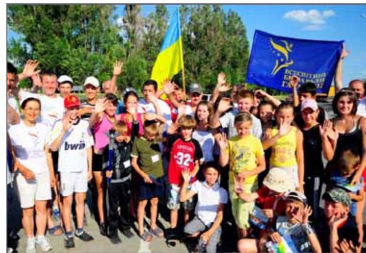
«Всесвітній біг заради гармонії»

Одна з таких акцій, яка стала, так би мовити, всесвітньовідомим брендом –