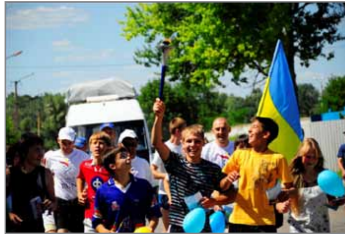
Міжнародна факельна естафета

людей вести активний спосіб життя, вживати здорову, органічну їжу, берегти екологію Землі, займатися фізичною культурою та спортом, прагнути до самовдосконалення.