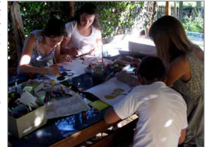
Вінницька обл., Ямпільський район, с. Буша