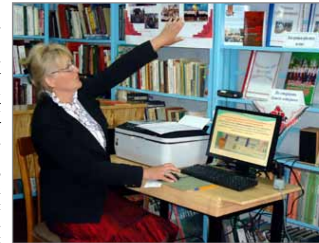
Новгородківський Ресурсний центр