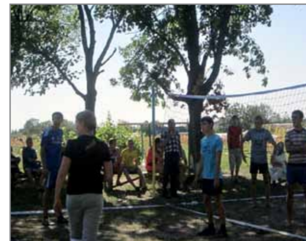
Спортивні змагання з волейболу