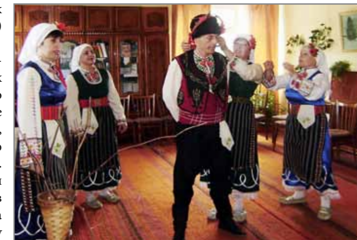
Відродження традицій національних меншин у Вільшанському районі Кіровоградської області

Із 51 проекту, які надійшли до ОЖІС, членам журі важко було відібрати 17 кращих,