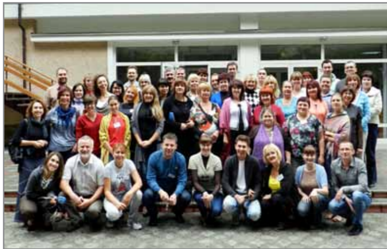
Міжнародна команда соціальних аніматорів

12 - 14 вересня 2012 року у Реколекційному Центрі «Світлиця» пройшов другий етап «Школи громадської участі». Нагадуємо, що перший етап був проведений 20-28 червня 2012 року у с. Піщане, Бахчисарайського району, АР Крим.