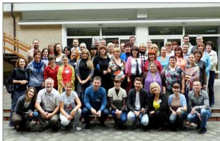
Міжнародна команда соціальних аніматорів

12 - 14 вересня 2012 року у Реколекційному Центрі «Світлиця» пройшов другий етап «Школи громадської участі». Нагадуємо, що перший етап був проведений 20-28 червня 2012 року у с. Піщане, Бахчисарайського району, АР Крим.