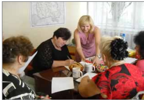
Засідання міні-клубу громадської активності

Також ГО «Взаємодія» підготувала проект «Популяризація виборів серед компаніївської молоді», який переміг в конкурсі міні-грантів в рамках програми «Молодь творить майбутнє» та за сприяння Національного фонду на підтримку демократії (NED). Проект направлений на вирішення проблеми низької активності молоді Компаніївського району у виборчому процесі. Для підвищення громадянської свідомості молоді і залучення до участі у парламентських виборах 2012 року ми плануємо сформувати команду соціальних