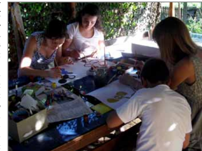
Вінницька обл., Ямпільський район, с. Буша