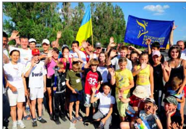
«Всесвітній біг заради гармонії»

Одна з таких акцій, яка стала, так би мовити, всесвітньовідомим брендом –