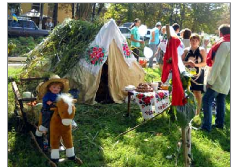
День Незалежності у смт. Компаніївка