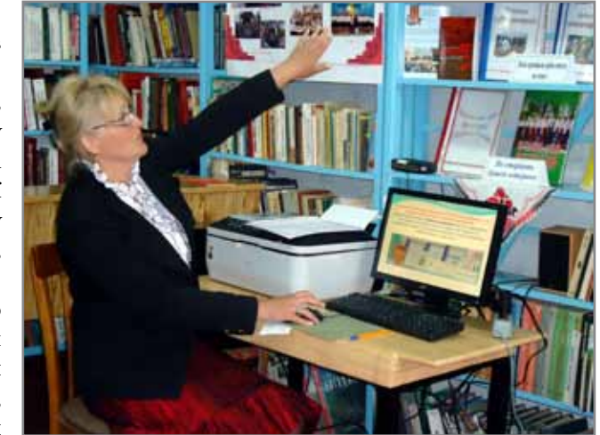
Новгородківський Ресурсний центр