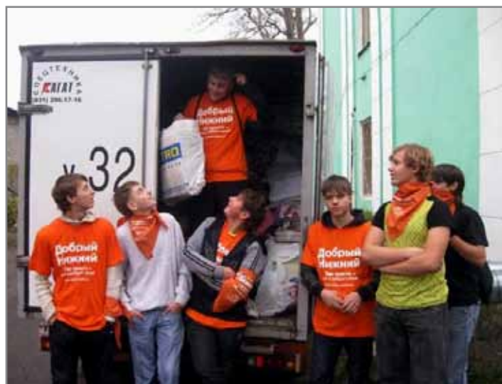
Акція «Непотрібний папір на потрібну справу!» в рамках фестивалю «Добрий Нижній»