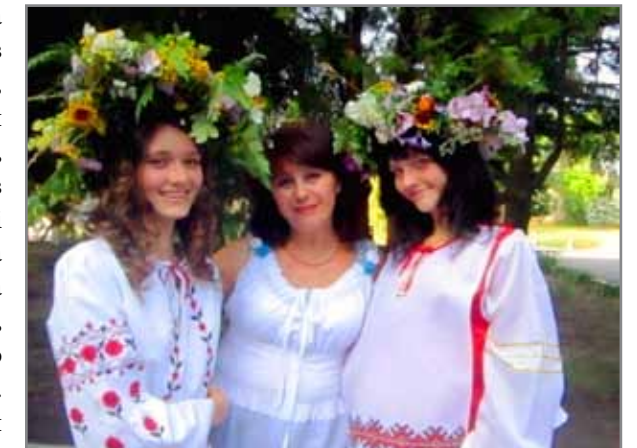
Свято «Івана Купала»

Восени цього року театр, що діє при Олександрівському Будинку культури з 1927 року (!) святкує свій ювілей – 85 – річчя. До