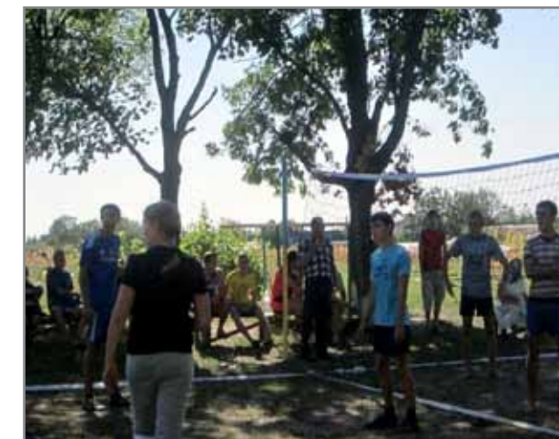
Спортивні змагання з волейболу