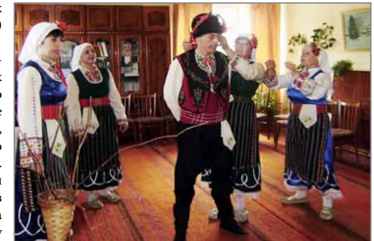
Відродження традицій національних меншин у Вільшанському районі Кіровоградської області

Із 51 проекту, які надійшли до ОЖІС, членам журі важко було відібрати 17 кращих,