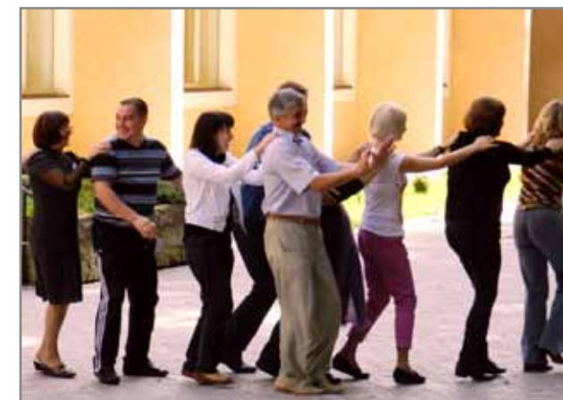
Разом крокувати завжди краще