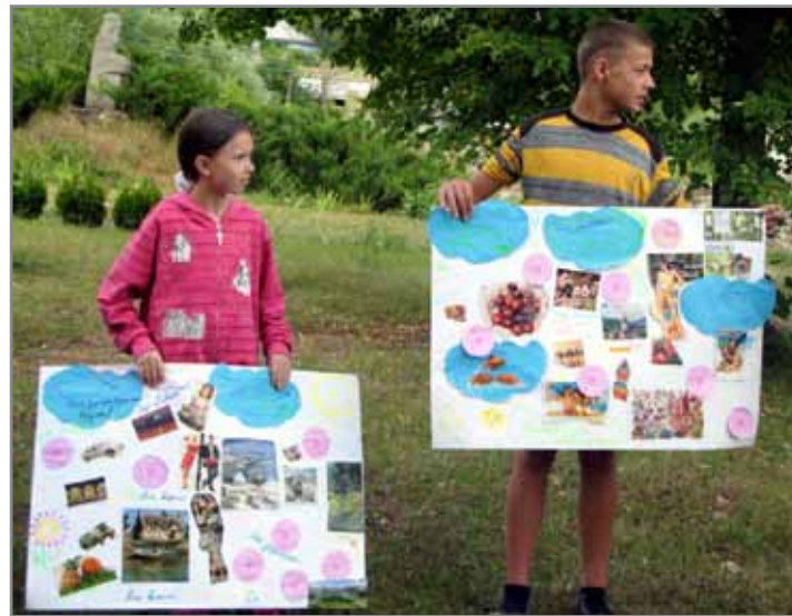
Мрії дітей про майбутнє рідного села

було зробити емблему команди із підручних засобів, таких як камінчики, палички, мох.