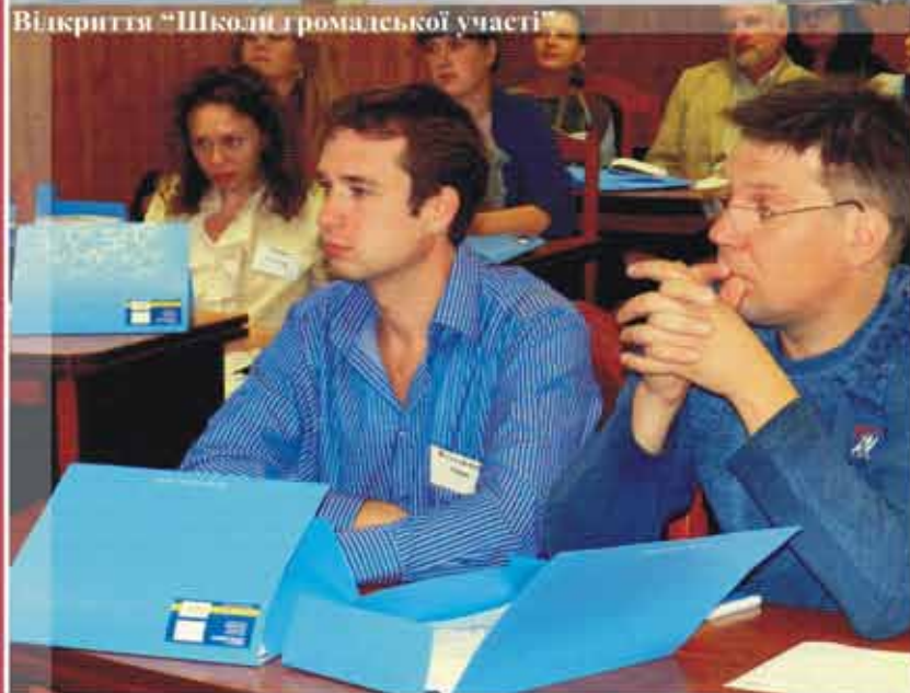
Відкриття “Школи громадської участі”