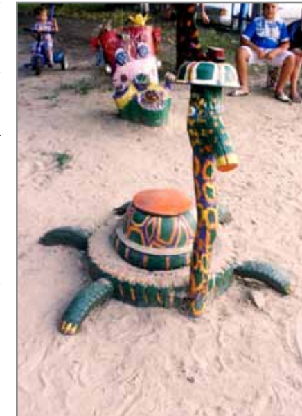
Свято можна зробити з підручних матеріалів