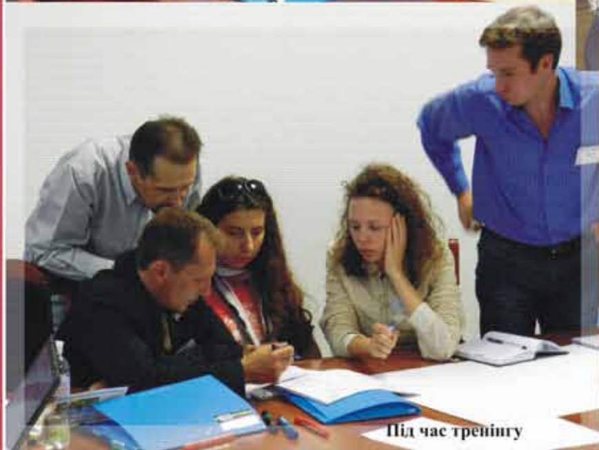
Під час тренінгу