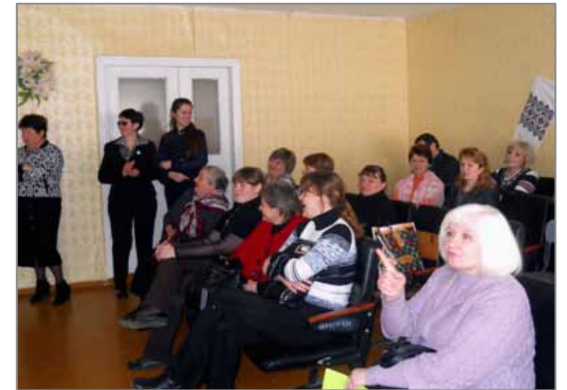
Глядачі Форум-театру теж брали активну участь у дійстві

групах, при цьому їх спектр може бути досить широкий. На сьогодні даний метод успішно використовується в роботі з дітьми і молоддю, представниками самих різних соціальних