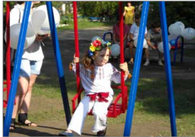
Відкриття дитячого майданчика

зібрала загальні збори громади, на яких було вирішено створити фонд громади, на кошти якого обновили звукову апаратуру в сільському будинку культури в 2012 році, а в подальшому зробити капітальний ремонт