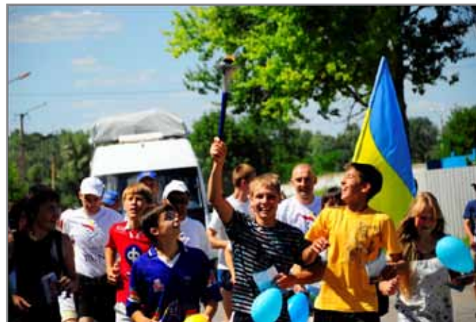
Міжнародна факельна естафета

людей вести активний спосіб життя, вживати здорову, органічну їжу, берегти екологію Землі, займатися фізичною культурою та спортом, прагнути до самовдосконалення.