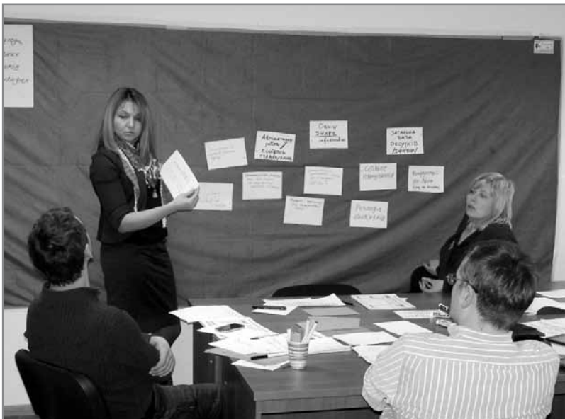
Сертифікаційний курс від ОО ІСА-Ukraine «Методи групової фасилітації»

14.00 до 14.30, у прямому ефірі в мережі Інтернет, через конференцію, яка створюється на Google+. Кожна людина за посиланнями, які поширюються через соціальні мережі, може переглянути передачу. Вона транслюється ще у прямому ефірі у мережі Facebook, на сайтах Інституту розвитку креативних технологій, а також на сайті Громадського простору».