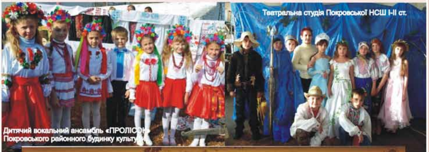
Фото-дайджест ініціатив від учасників “Школи громадської участі”