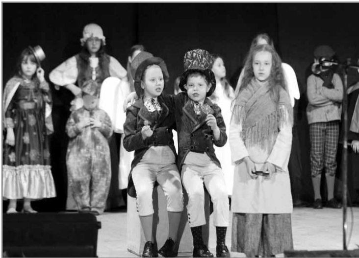
Спектакль «Дівчинка із сірниками»

жіночого клубу міста Києва, БФ «Фонд Громади Приірпіння» та Іменного фонду Дмитра Воцеха розкриється великий проект співпраці дитячого театру та дітей-інвалідів. В рамках проекту буде здійснена театральна постановка із створенням спеціальних декорацій та костюмів, і де гратимуть також діти з особливими потребами. У такий цікавий творчий спосіб проходять частково заняття «Школи нових можливостей», де дітки-інваліди матимуть змогу виражати себе у творчості, розвиватися, позбуватися комплексів та фобій, грати на сцені та розвивати свої таланти.