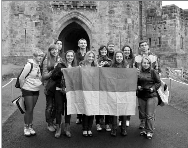
Українська делегація на тлі замку, де знімався Гаррі Поттер (місто Елнвік)

Автор статті відвідала кафе соціальної спрямованості в депресивному селищі Ізінгтон. Шахти в цієї місцевості зачинені вже багато років, роботи не має, високий рівень безробіття, наркоманії, алкоголізму. Соціальне кафе для представників