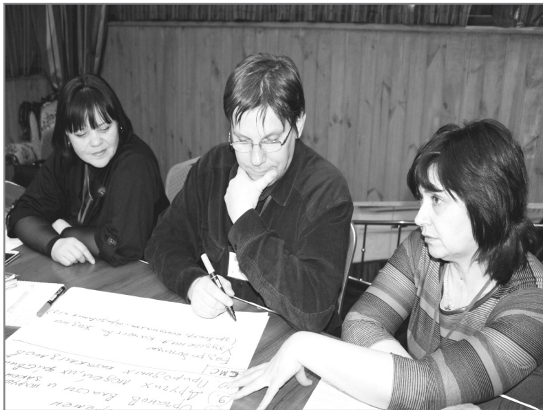
Робота у групах