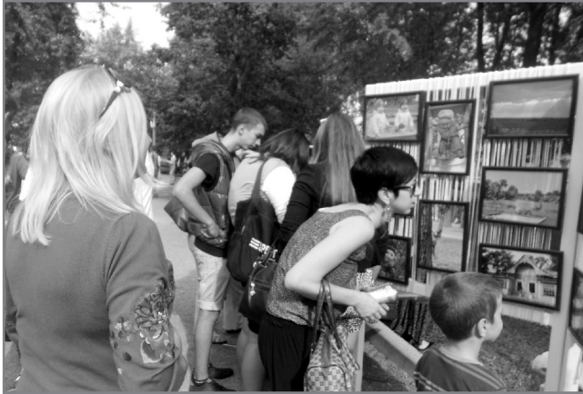
Фотосушка «Позитивний погляд - 2012»

фінансування соціальних проектів – провели ярмарок молодіжних ідей, залучивши до цього бізнесменів.