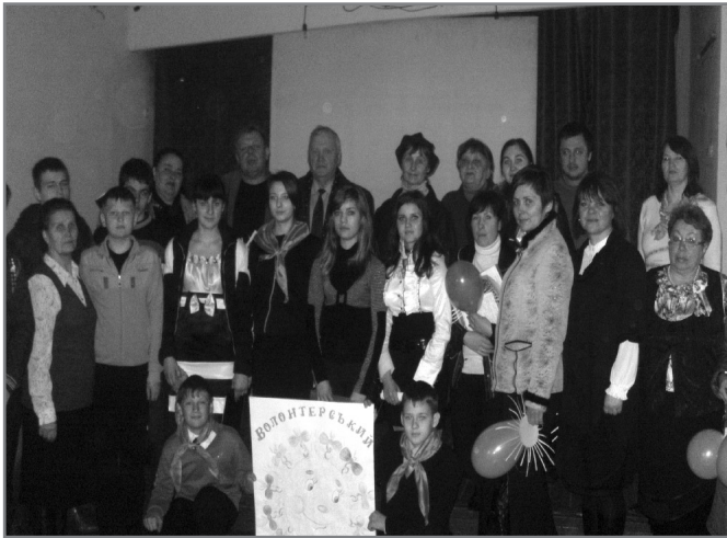
Волонтерський рух "Добротворець"

що соціальне нездоров'я з кожним роком вражає все більше дітей та підлітків. Це виражається у зростанні злочинів серед учнівської молоді. Проблема соціального здоров'я сьогодні чи не найактуальніша в шкільній освіті. Останнім часом вивчення проблеми соціального здоров'я взагалі та розкриття сутності поняття "соціальне здоров'я особистості" зокрема привертає все більше уваги вітчизняних і зарубіжних учених. Дослідження різних аспектів даної проблеми знайшли відображення у працях Т. Башкиревої, Л. Горяної, С. Кириленко, В. Колесова, Л. Колпіна, А. Мишиної, В. Мягих, Г. Нікіфорова, В. Бабича та інших. Проблема соціального здоров'я підростаючого покоління набула актуальності у вітчизняних та зарубіжних дослідженнях. Водночас можна зазначити, що в Україні недостатньо уваги приділяється зазначеній проблемі, незважаючи на те, що питання формування соціального здоров'я сучасної української молоді є нагальним. Вітчизняна вчена С.Свириденко окреслює соціальне здоров'я як функціонування особистості в ролі повноправного члена суспільства, його безконфліктну взаємодію з навколишнім світом, доброзичливі взаємини у колективі однолітків, у сім'ї, суспільстві [3].