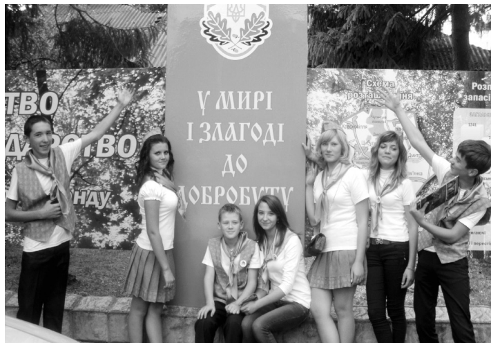
Акція “У мирі і злагоді до добробуту”

Волонтерство – найпопулярніший компонент моделі громадсько-активної