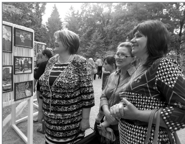
Фотосушка «Позитивний погляд - 2012»

- Найбільше ми любимо «Позитивний погляд», котрий реалізуємо вже третій рік поспіль. Ми проводимо його спільно з молоддю міста та молодіжним клубом «Позитив», що діє на нашій базі. Спочатку проводимо тренінгові заняття з школярами по вмінню бачити позитивні моменти та зрушення у нашому житті. Потім школярі фотографують та подають на конкурс свої фотографії. Кожного року визначаємо тематику окремих номінацій: «Боярка історична», «Я – патріот», «Затишні куточки міста», «Боярська сім'я», «Хвостаті позитивчики» тощо. Коли ми вперше виставили фотографії на день міста, був справжній фурор і купа емоційних відгуків. Аж денна наша Боярка багатьох здивувалася через призму невдоволення та негативу, фокусуючись на недоліках. А завдяки нашій виставці боярчани подивилися на рідне місто позитивним поглядом і побачили, що існують прекрасні затишні куточки, де можна відпочити з дітьми, запросити гостей міста. Виставка була настільки успішна, що міський голова попросив, щоб ми проводили подібну виставку щороку. Ми задіємо креатив, шукаємо для виставки різні формати, тож у 2013 році, організували