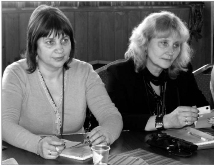
Визначення очікувань та побоювань тренінгу

Серед того, чим пишається місцева громада, учасники виділили : працелюбних добрих активних людей, традиції та звичаї,