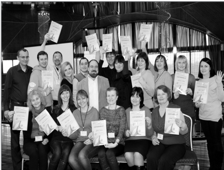
Учасники тренінгу “Розвиток місцевих громад”

Тож, визначення місцевої громади, запропоноване тренером, наступне - це населення, яке проживає в міських, сільських поселеннях та на інших територіях, в межах яких здійснюється місцеве самоврядування. Місцева громада будується на двох підставах: місцева громада по інтересам і громада місця.