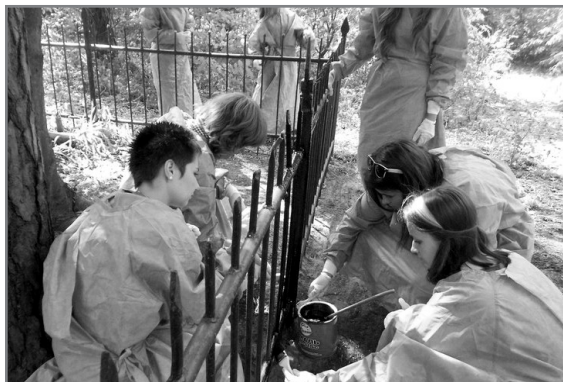
“Позитивні лісовички - 2012”

- Як раз на тренінгу “Розвиток місцевих громад” було дуже гарно сказано, що заробітна платня – це своєрідний «хабар» родині за можливість займатися улюбленою справою. Приблизно так і в мене. Донька у мене вже доросла, заробляє на життя сама. Чоловік пенсіонер, а я приношу заробітну