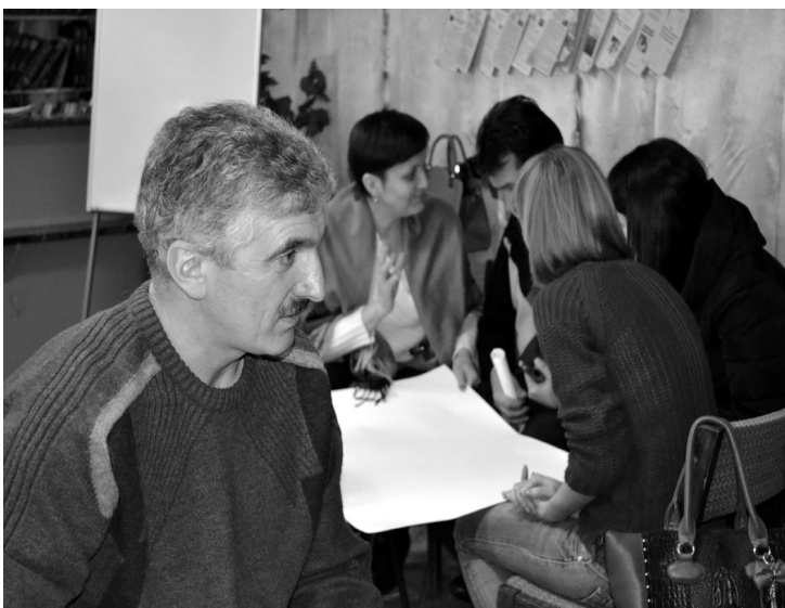
Робота у групах