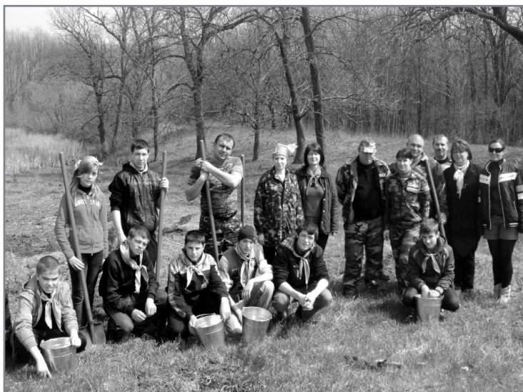
Команда волонтерів на прибиранні території

У нашому селі Іванівка в рамках гуманітарної програми, що підтримувалась Міжнародним фондом «Відродження» було створено при Будинку культури Центр місцевої активності і взаємодопомоги «Ковчег», що об'єднує активних, творчих людей, які орієнтовані на ідеали громадянського суспільства, на демократизацію всіх сфер соціального життя.