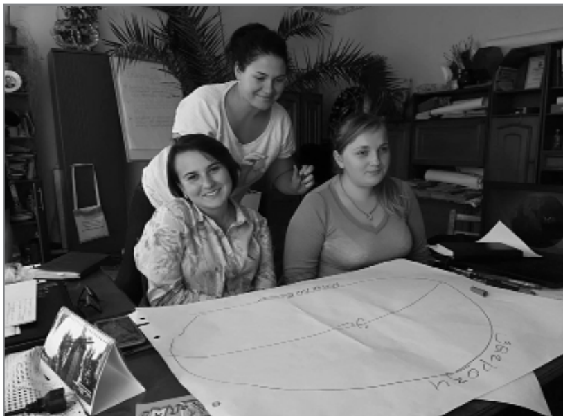
Проведення тренінгу в громаді

А ще за легкість і доступність інформації, за практичні завдання, які підкріплювали теорію і просто за те, що було дуже цікаво та весело навчатися!