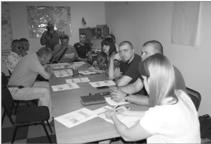
Проведення заходу з громадою

додаток 5: “Кошторис витрат на утримання будинку та прибудинкової території”.