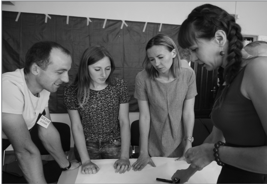
Робота на тренінгу в рамках проекту «Участь через залучення»

населення, для об'єднання людей. Це нестандартна футбольна команда 26 гравців різного віку, де наймолодшому 15 років, найстаршому десь близько сорока буде. Останнє, що зробили це закупили для них форму. Є ще Центр громадської адвокатури у Львові, де я працюю координатором проектів і ми працюємо з 2016 року так саме з об'єднаними територіальними громадами у Львівській області.