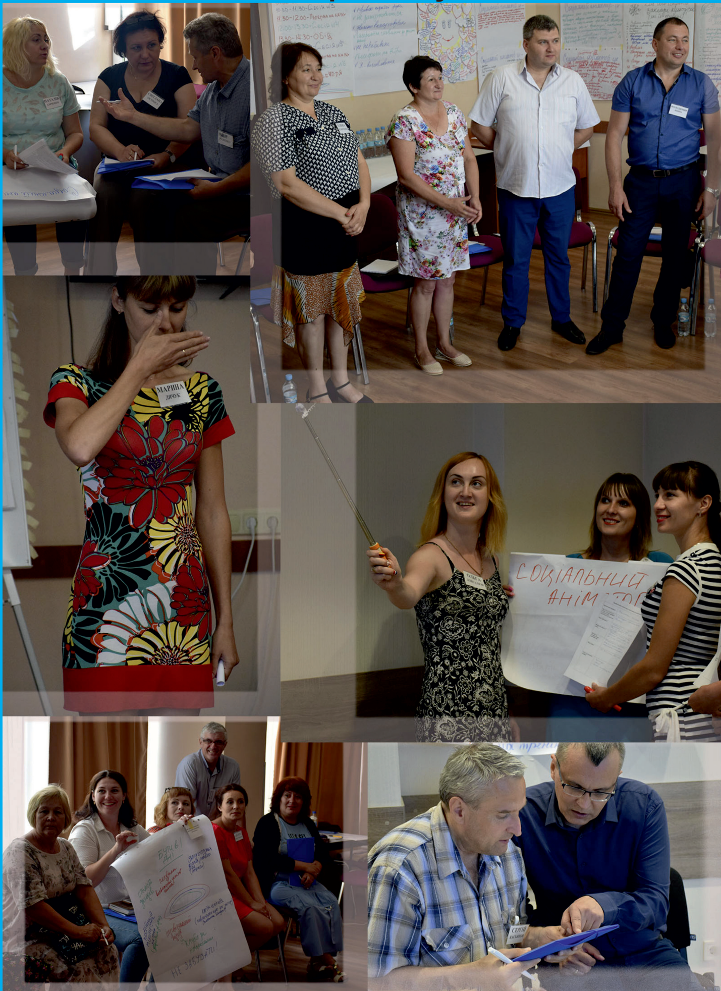
Фото-дайджест проекту “Участь через залучення”