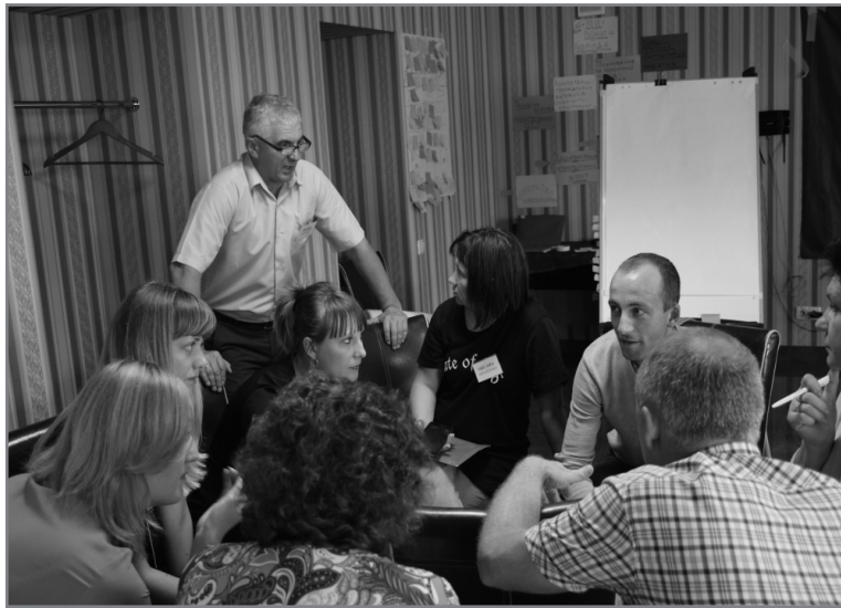
Проведення тренінгової сесії

Головне – люди повинні розуміти, що це їм потрібно. Коли люди визначають певну ініціативу, або підтримують її, саме тоді вони долучаються до цього процесу. У нас є цікавий приклад роботи із створення зони роздільного сміття у нашій громаді по одному будинку із ОСББ спільно із