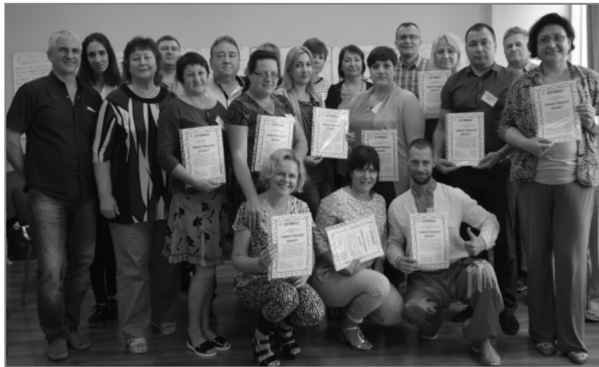
Учасники та учасниці першої групи тренінгу «Анімація громадської діяльності»

Також заплановано проведення конференції «Участь через залучення», метою якої буде обговорення проблем, змісту, методів і перспектив роботи громадських активістів (соціальними аніматорами) задля формування їх громадянської свідомості і підвищення рівня участі в громадській діяльності на місцевому рівні; визначення позиції громадського активіста у сучасних суспільно-політичних умовах. Випуск та розповсюдження видання з «історіями успіху» від учасників та учасниць навчальної програми.