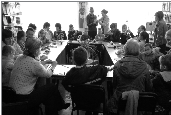
Заняття в бібліотеці

«Покрова – берегиня роду», присвячена святу Покрови Пресвятої Богородиці, Дню українського козацтва та Дню захисника України, яку організували працівники Приютівської бібліотеки – філії, Цукрозаводського БК та члени Приютівської молодіжної ради. Запрошений