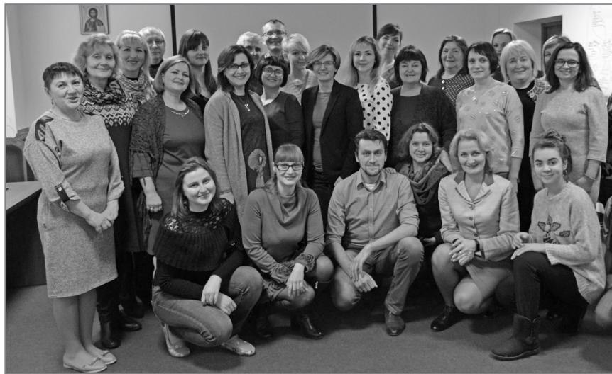
Учасники 4 національної конференції «Соціальна анімація для розвитку культури та громад»

Не обійшлося і без практики, наприклад, учасники мали змогу спробувати себе в ролі запрошеного чи запрошеної до участі в тій чи