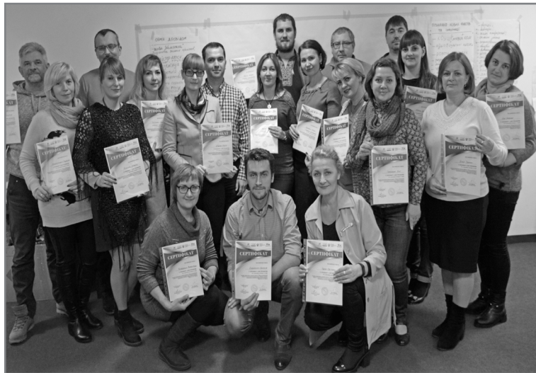
Учасники тренінгу для тренерів

Вся причина в тому, що бібліотеки у Польщі законодавчо захищені від закриття і