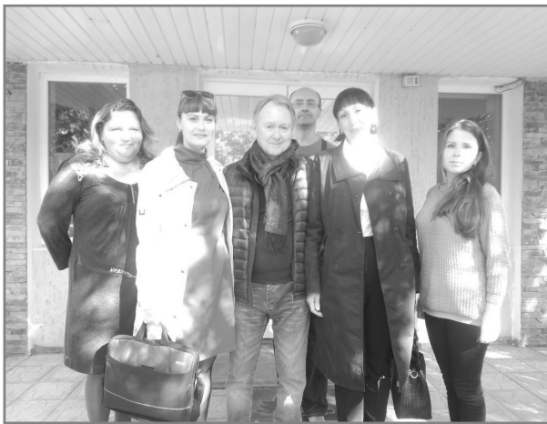
Громадські активісти м. Новий Буг з волонтером з Великобританії