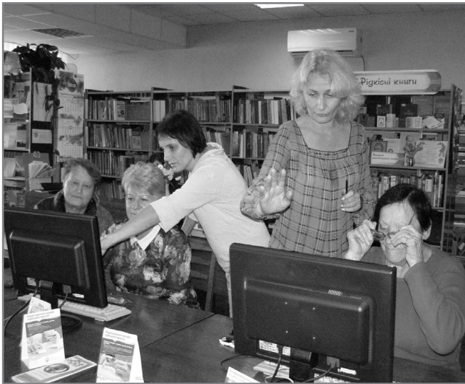
Навчання комп'ютерної грамотності

Вважала так завжди і це було моїм головним принципом в роботі, хоча я, як і багато інших, не змогла уникнути такої проблеми, як «професійне вигорання».