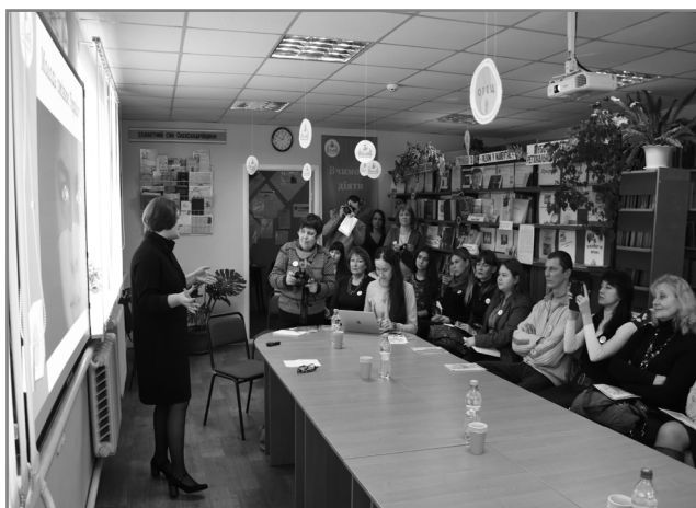
Відкриття «Школи громадського аніматора»

В рамках проекту Молодіжні ради сформувалися і вже починають працювати, але наша організація в деякій мірі відчуває свою відповідальність за подальше їх функціонування. На наступному етапі, післяпроектному, плануємо знайти чи то громадські організації, або ж конкретних людей, які теж розвивають або ж працюють з молодіжними радами. Було би добре мати контакти цих людей, аби обговорити можливість обміну досвідом, партнерства, написання спільного проекту. Прочитати інформацію про досвід роботи то добре, але ми б хотіли аби наша молодь мала можливість поспілкуватись з членами молодіжних рад, побачити їх здобутки, послухати історії невдач і розчарувань, якщо вони були. Плануємо писати проект, що включатиме конкурс молодіжних